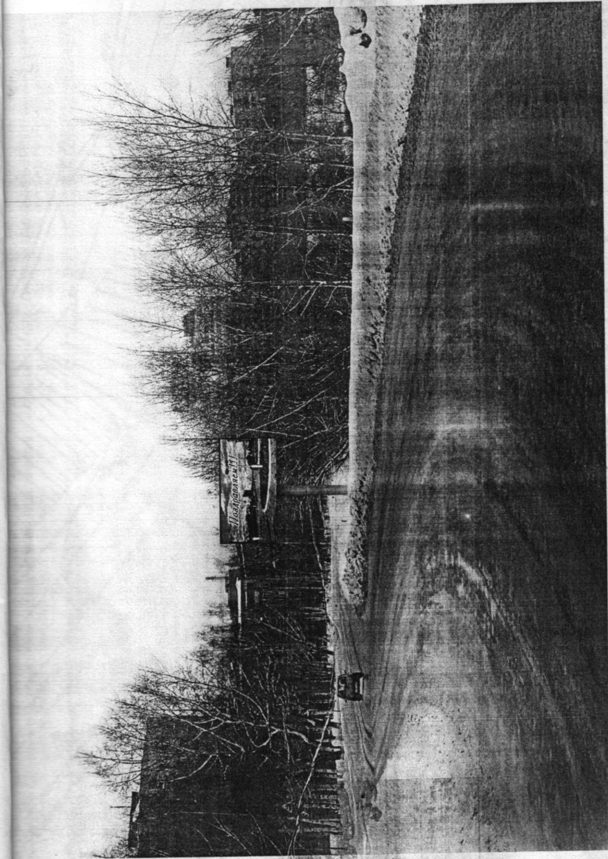
БИЛБОРД БЗ: ул. ЧЕПЕЦКАЯ